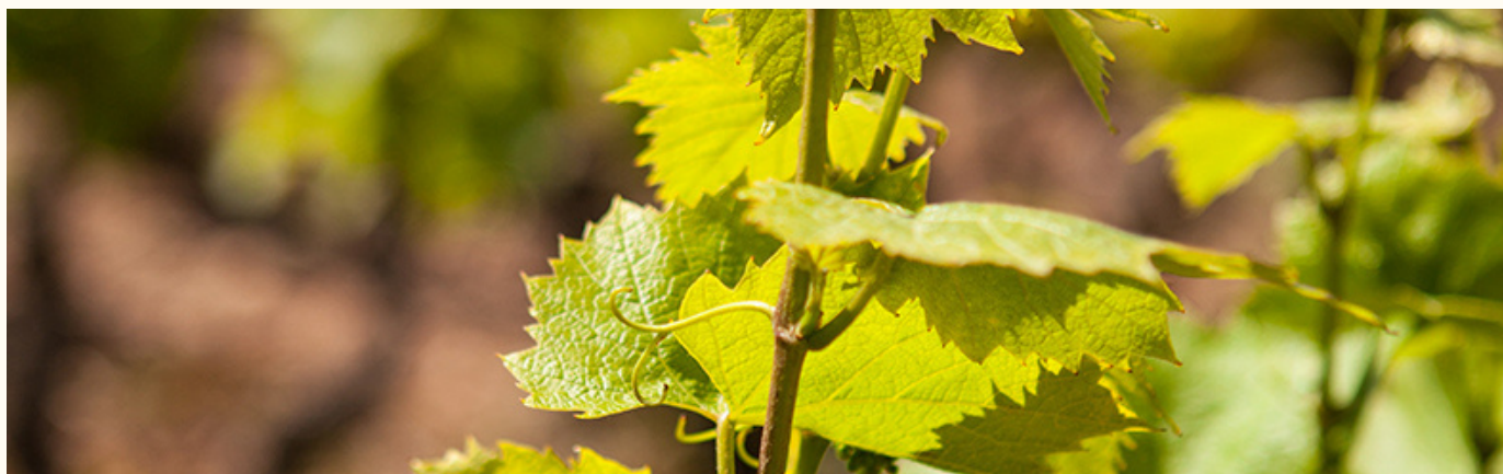
LES VIGNES AU 21 JUIN 2021