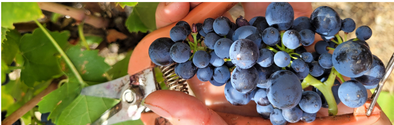
GRAPPE GAMAY NOIR

ON EST AUX PORTES D'UN GRAND MILLÉSIME !